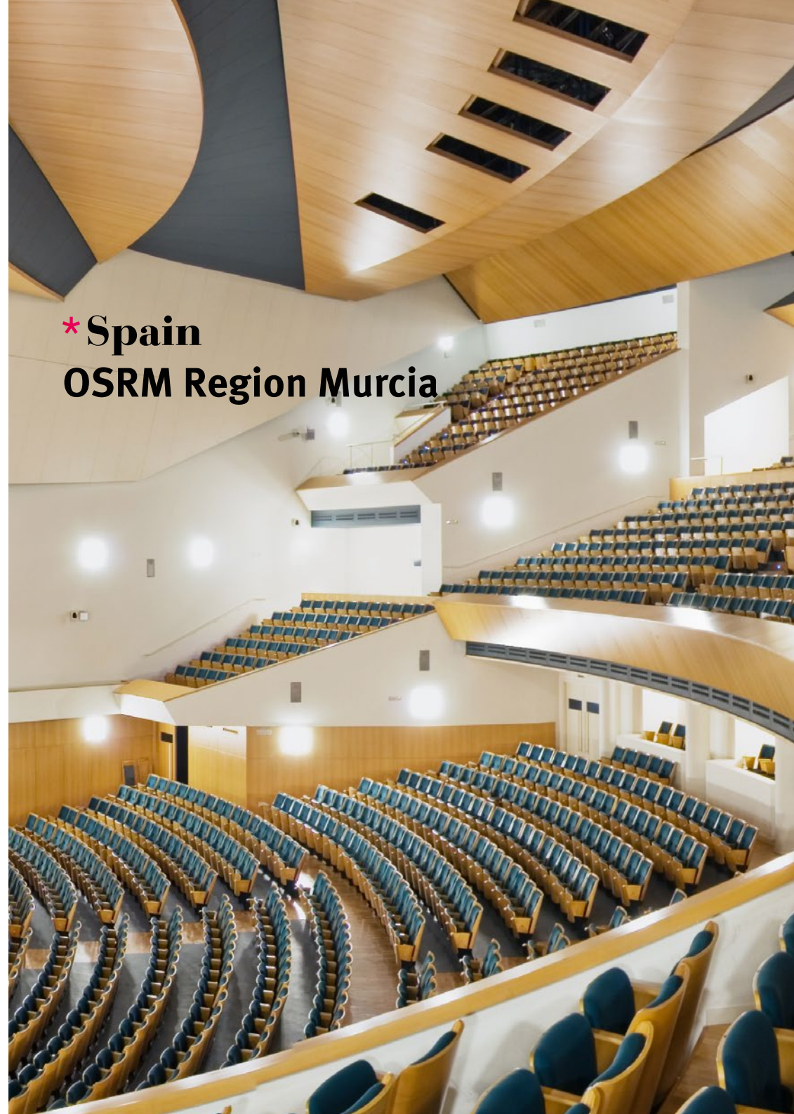
*Spain OSRM Region Murcia