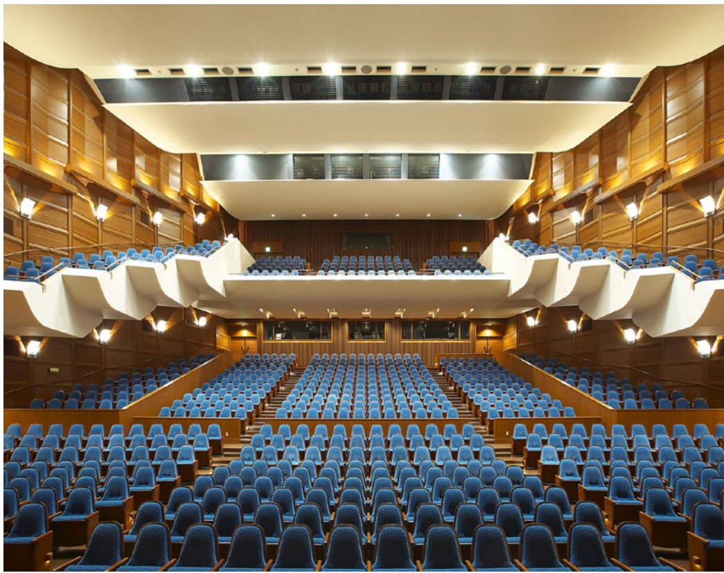
* Japan Tokyo Metropolitan Opera Foundation