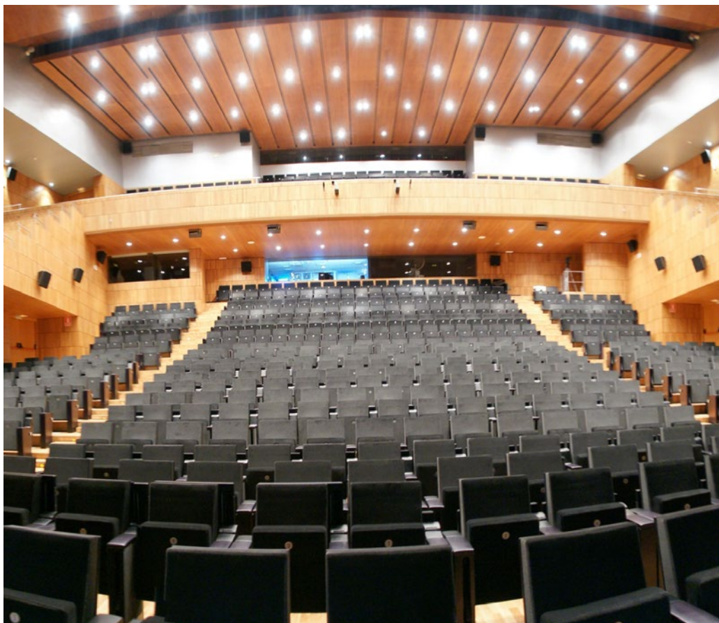
*Spain ORA Lirica Aragon