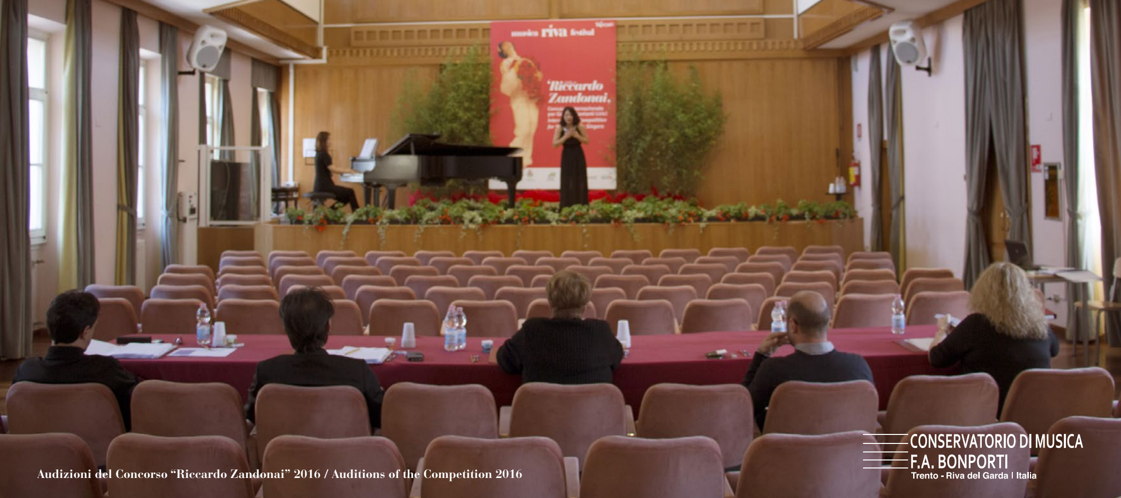
Audizioni del Concorso “Riccardo Zandonai” 2016 / Auditions of the Competition 2016

CONSERVATORIO DI MUSICA F.A. BONPORTI Trento - Riva del Garda | Italia