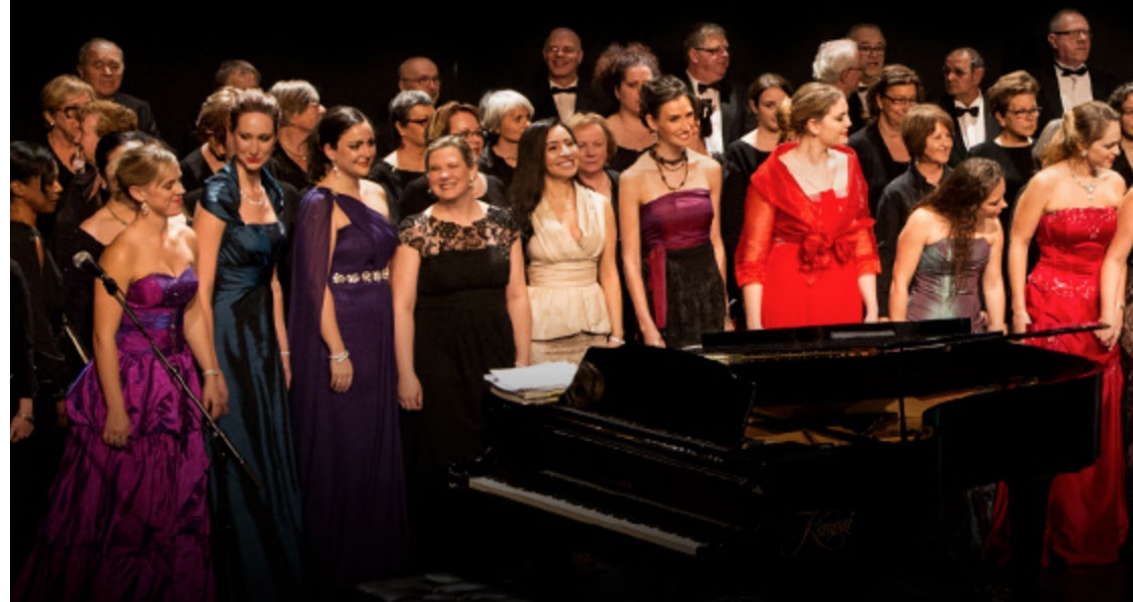
*Canada Jeunes Ambassadeurs Lyriques