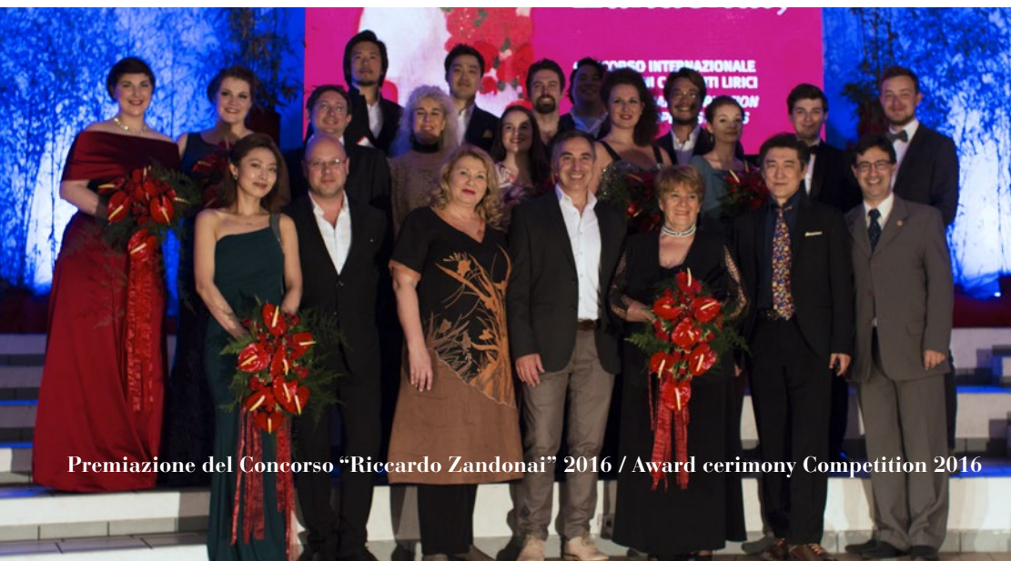
Premiazione del Concorso "Riccardo Zandonai" 2016 / Award ceremony Competition 2016

The places will be assigned following the entry order of the applications and payments.