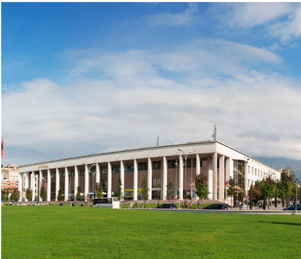
*Albania Teatro Nazionale dell'Opera e del Balletto di Tirana