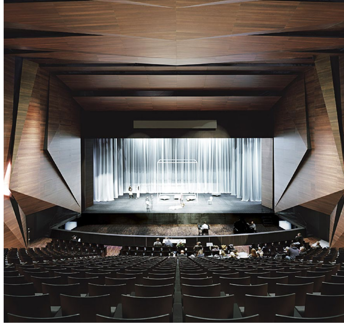
* Austria Tiroler Festspiele Erl