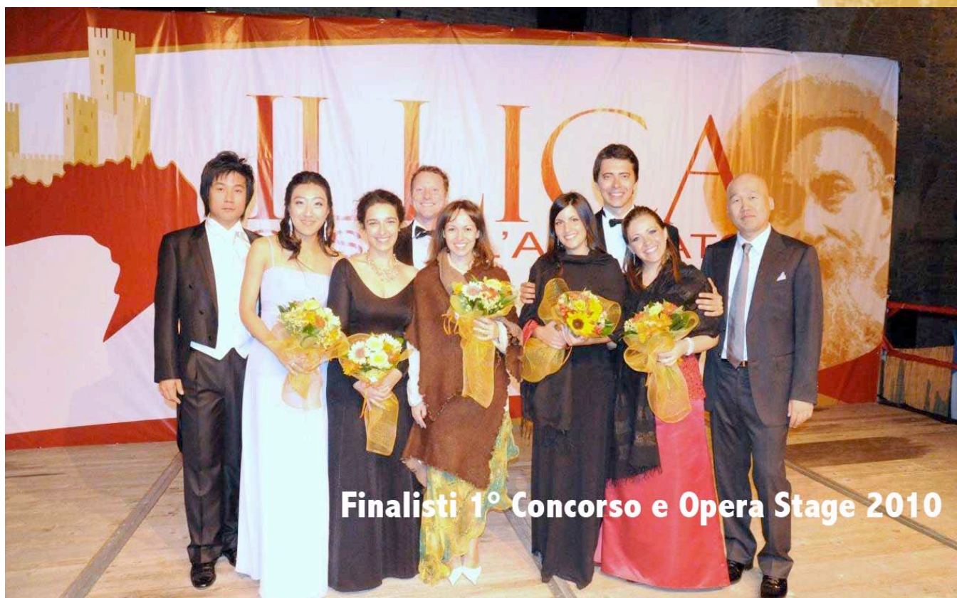
Finalisti 1° Concorso e Opera Stage 2010