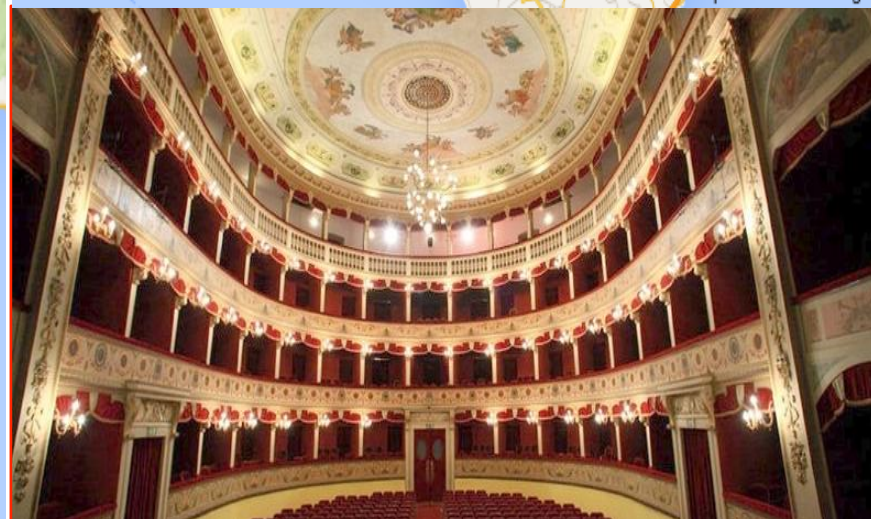
* Teatro Luigi Pirandello Piazza Prandello ,1 92100 Agrigento