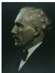
I.S.S.M. Arturo Toscanini Ribera