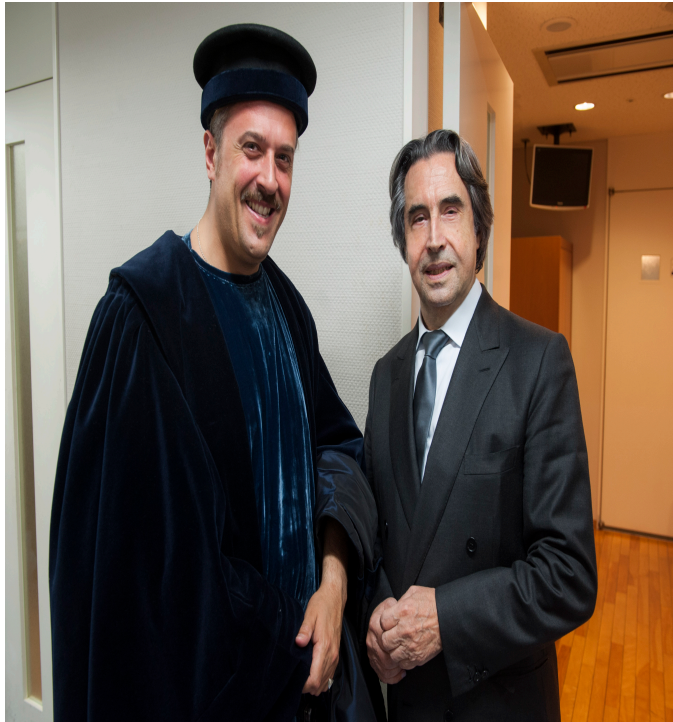
M° Riccardo Muti

Agrigento Teatro Luigi Pirandello - Foyer 29 Agosto - 2 Settembre 2016