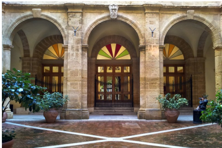
Ingresso Foyer Teatro Luigi Pirandello