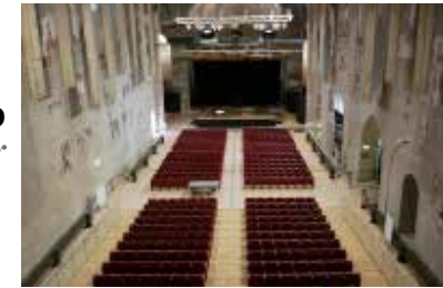
AMICI DELLA MUSICA FOLIGNO Italia Italy