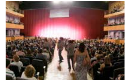
* CIA ÓPERA SAO PAULO Brasile Brazil