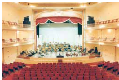
THEATRO S. PEDRO S. PAULO Brasile Brazil