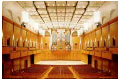
TOYOTA CITY CONCERT HALL Giappone Japan