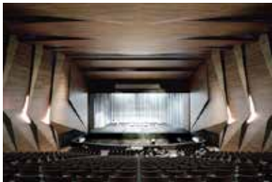
TIROLER FESTSPIELE ERL Austria