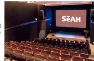
** WOON HYUNG LEE FOUNDATION Corea Korea