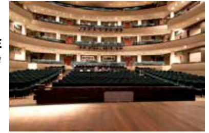
DAEGU OPERA HOUSE Corea Korea

Participation to concerts or opera performances in a role to be agreed