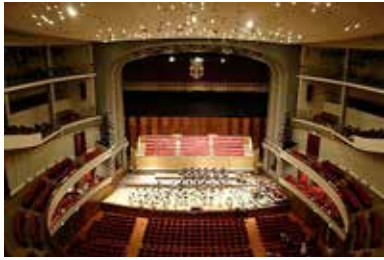
FONDAZIONE TEATRO MAGGIO MUSICALE FIORENTINO Italia Italy

Partecipazione retribuita a concerti o spettacoli operistici, in un ruolo da concordare