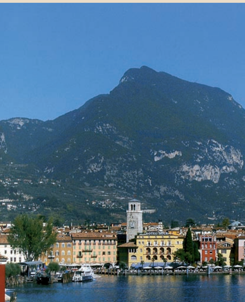
Veduta di Riva del Garda dal lago View of Riva del Garda from the lake