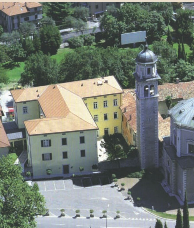
Veduta del Conservatorio di Musica "F. A. Bonporti" di Riva del Garda View of the Conservatorio di Musica "F. A. Bonporti" - Riva del Garda